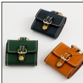
コインケース 3,300円(税込)