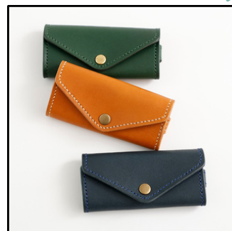
4連キーケース 4,180円(税込)