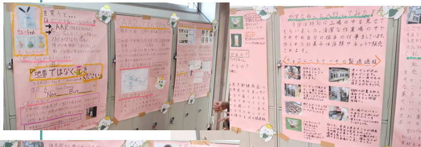
文化祭での展示。フェアトレードや福祉施設の取り組みが、生徒の皆さまの言葉で紹介されています。