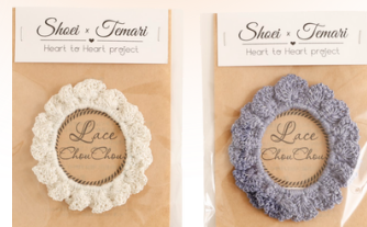
ふわキラ可愛い レースシュシュ