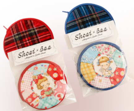
制服がモチーフのポーチとブックエンド！