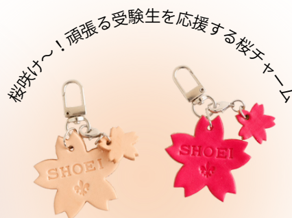
桜咲け～！頑張る受験生を応援する桜チャーム