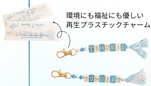
環境にも福祉にも優しい 再生プラスチックチャーム

頌栄女子学院様といえば、可愛い制服が広く知られています！その制服をテーマに、生地やリボン、色合いを選び、商品に反映しました。また「受験生を応援したい」との声から、合格祈願の桜チャームも誕生。さらに、モールZooの服は生徒様が夏服をイメージして編み上げてくださり、施設利用者様と心をひとつにした温かい商品が完成しました。まさに「思いはひとつ・喜ばれるものを作りたい」という願いが形になった瞬間でした。