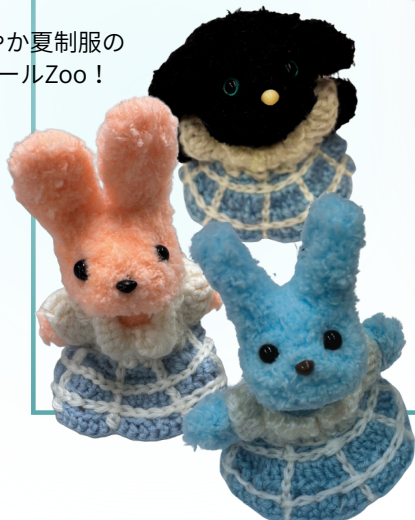
爽やか夏制服の モールZoo！